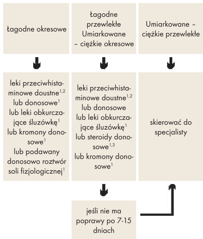
Tabela VI Objawy alergicznego nieżytu nosa